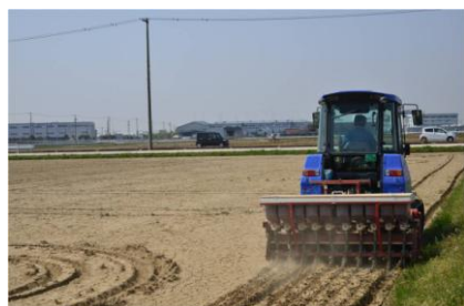
モミをじかに蒔いています